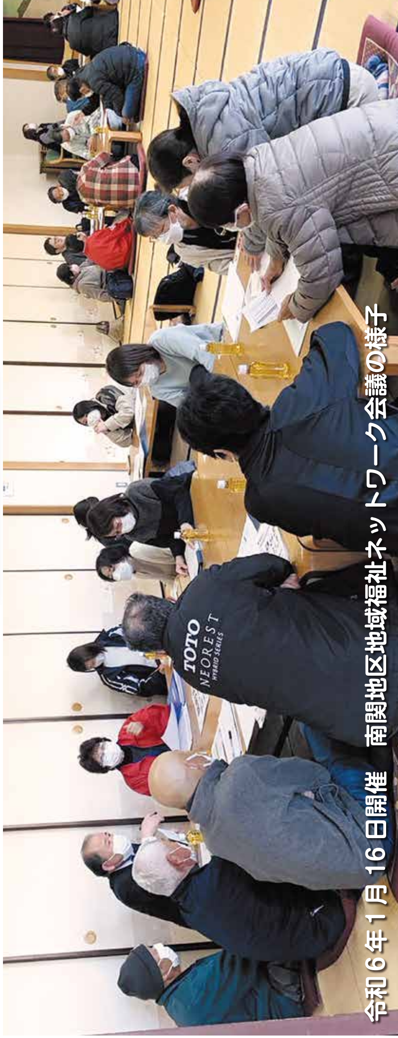
令和6年1月16日開催 南関地区地域福祉ネットワーク会議の様子