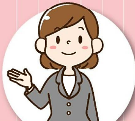
主任ケアマネジャー

保健師、社会福祉士、主任 ケアマネジャーなどの専門 職が、連携し総合的な支援 を行います。