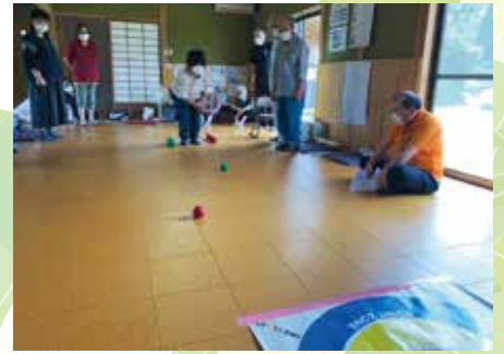
ペタリングで交流