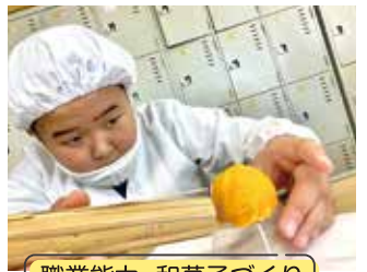
職業能力 和菓子づくり