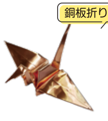
銅板折り鶴づくり