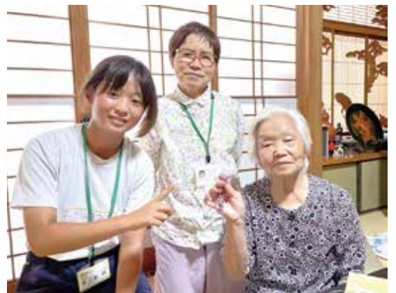
▲職場体験に参加した中学生が社会福祉協議会や民生委員・児童委員の活動を知る機会となりました。