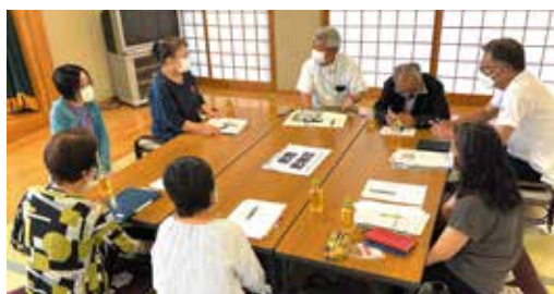
各グループに社会福祉協議会の職員も入ってネットワーク会議で近況確認

4人の福祉員に、地域の公民館でおこなう茶話会(ふれあいサロン)の運営補助や、日常的な見守り活動にも協力してもらっています。また、私の担当地区を4つに分けて訪問活動を強化しています。 困った時には相談もできるので、福祉員には 福祉活動の応援団 として助けられています。