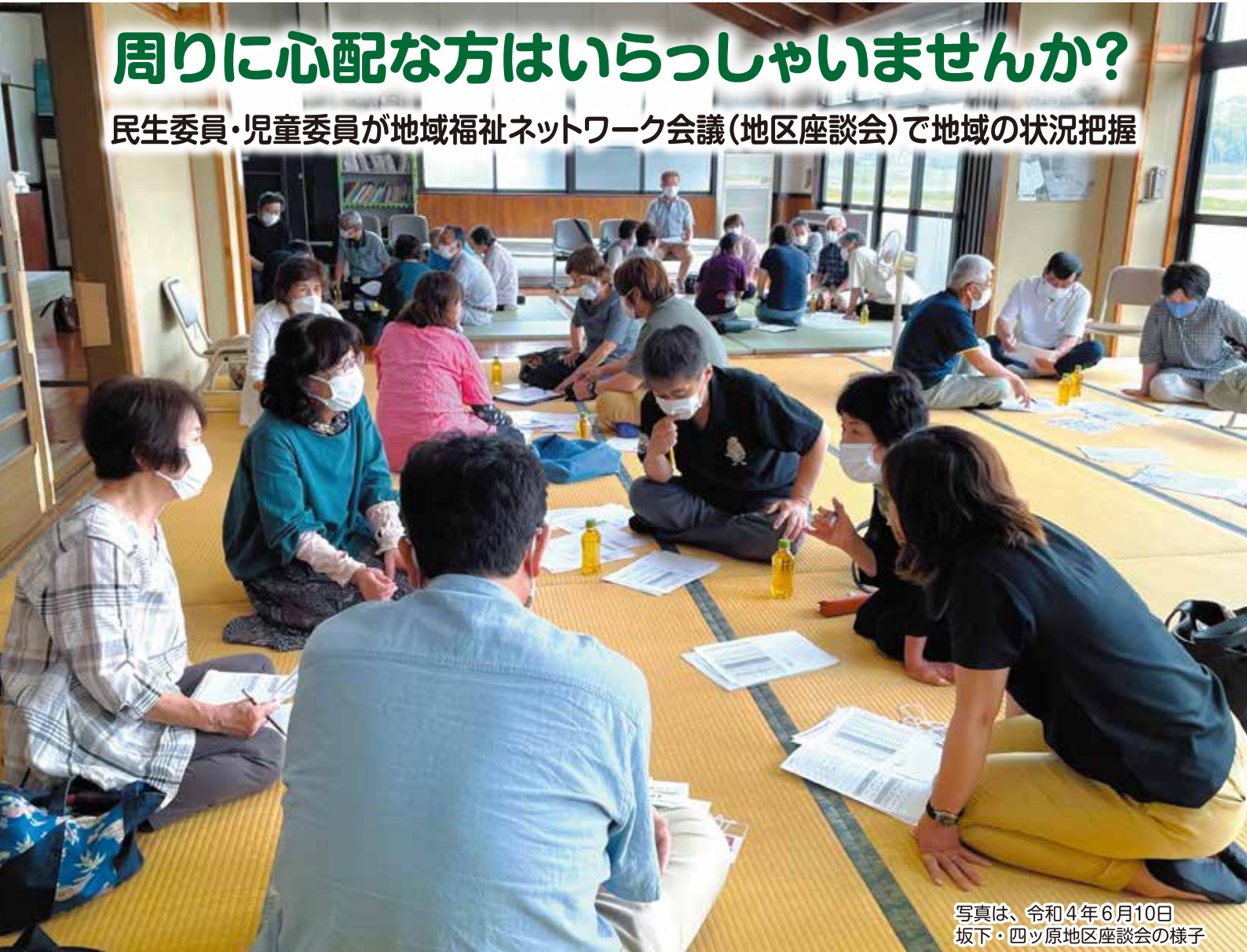
写真は、令和4年6月10日 坂下・四ッ原地区座談会の様子