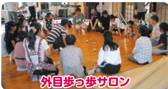
外目歩っ歩サロン

【活動】保育園での読み聞かせ他「七夕おはなし会」「読書のつどい」を開催されています。