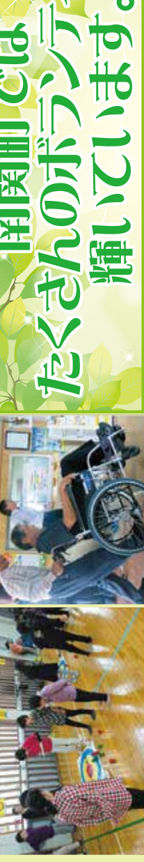
福祉施設で高齢者ボランティア (五箇年計画推進協議会)