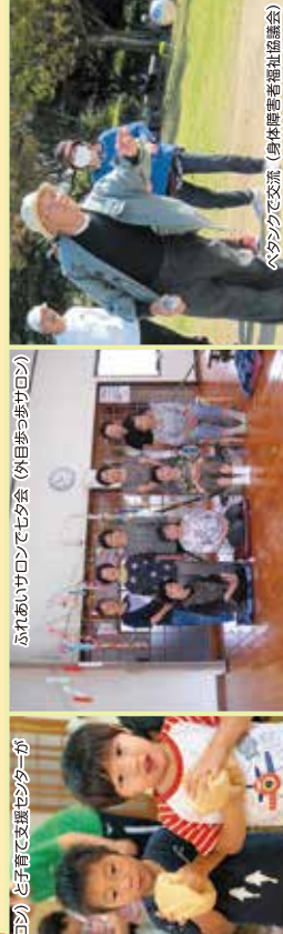
ふれあいサロンで七夕会 (外日歩みサロン)

もやい生活支援サービスは、依頼会員（日常生活の中で援助を必要とする人）に対して、1回30分以内でできる軽作業を協力会員（援助できる人）がお手伝いする会員制の住民参加型在宅福祉サービスです。