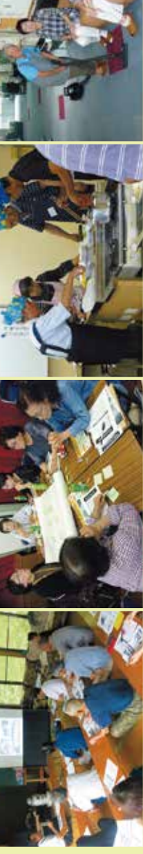
保護者のみなさんと打ち合わせ (民生委員児童委員協議会)