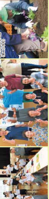
第三小学校で思いきり学習 (社会福祉協議会)