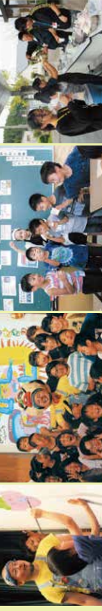
夏休みのほろけ教室で食育講座を実施 (社会福祉協議会)