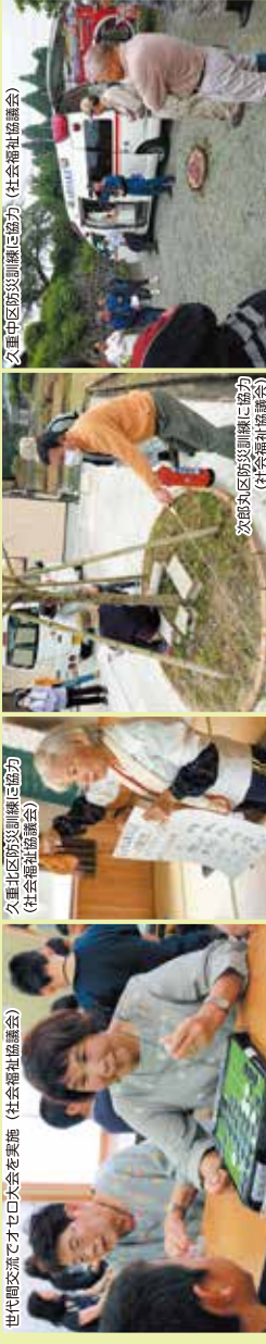
久串地区防犯訓練に協力 (社会福祉協議会)