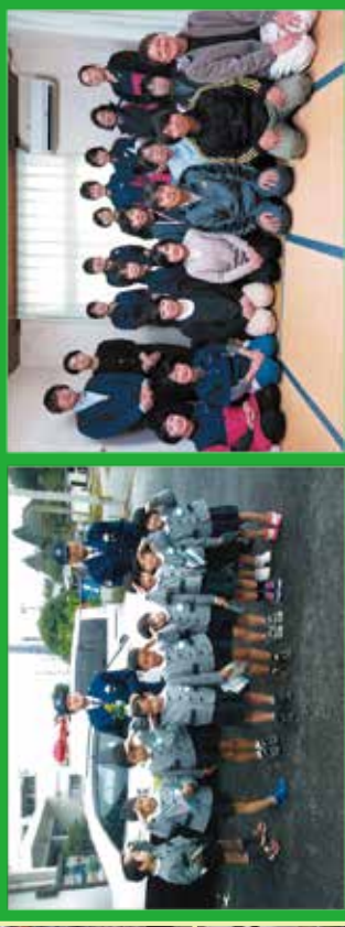
文化幼児園から表敬訪問 (地域警察連絡協議会) 見守りパトロールに協力 (社会福祉協議会)