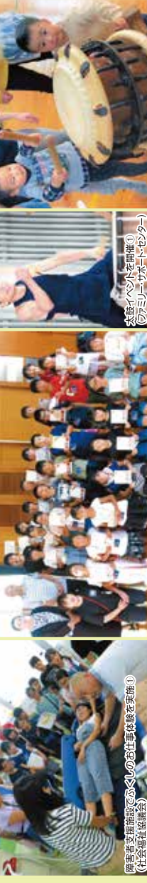
大塚イベントを主催 (ファミリーサポートセンター)