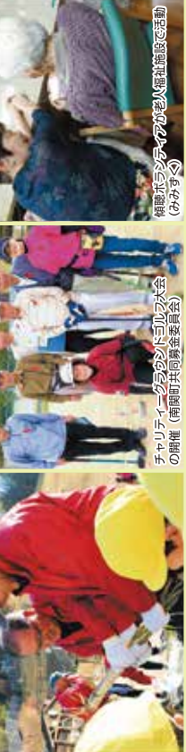
チャリティオークションに協力 (南関町共同募進委員会)