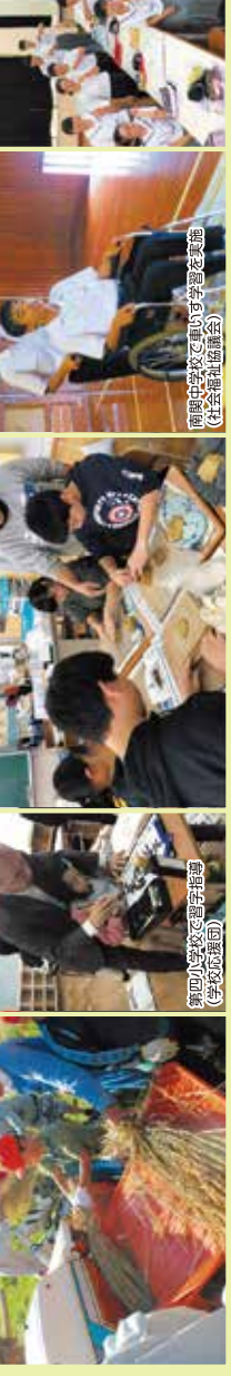
南関中学校で思いきり学習を実施 (社会福祉協議会)