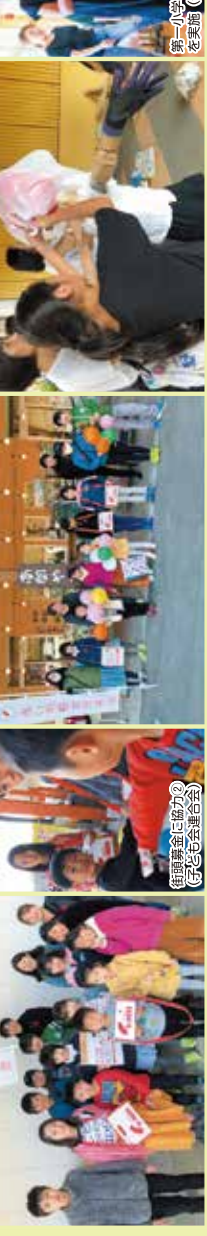
第一小学校で思いきり学習 (社会福祉協議会)