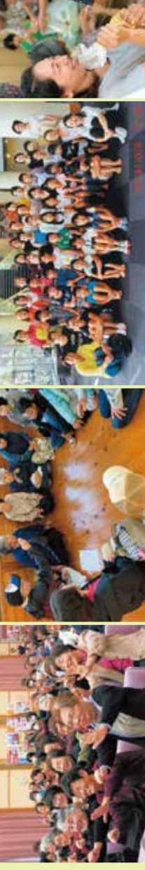
サロンで地域交流 (南関町共同募進委員会)