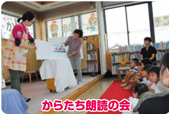
からたち朗読の会