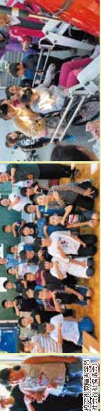
第三小学校で思いきり学習 (社会福祉協議会)