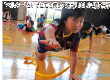
3B体操 ペルターというヒモを使って運動しました (低・高学年)