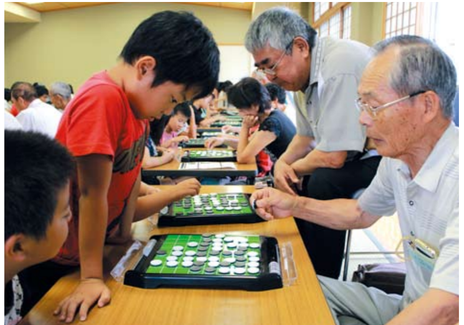
子どもと大人の真剣勝負!