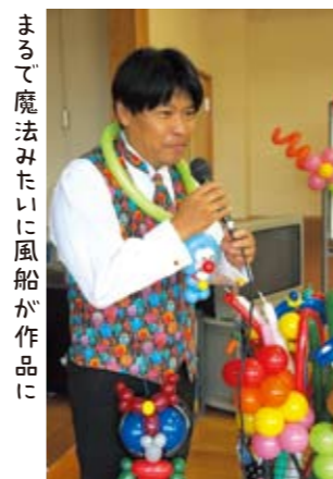
優勢で思わずにっこり まるで魔法みたいに風船が作品に