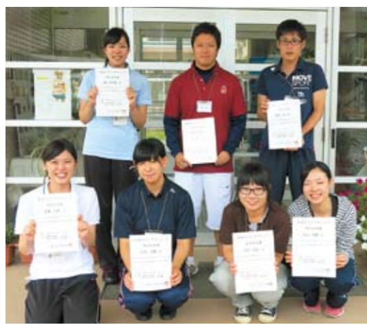
短い時間でしたが貴重な体験ができました