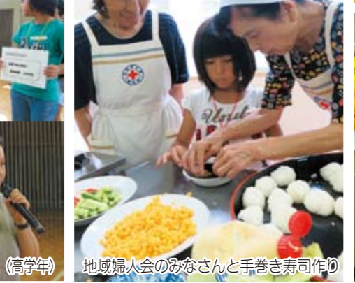
ボランティア 地域婦人会のみなさんと手巻き寿司作り