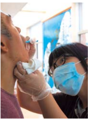
歯磨き介助を体験