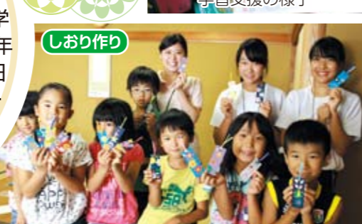
しおり作り 色とりどりのしおりが完成 (低学年)

夏休み中の小学生を対象に、低学年45人(8月6日~8日)、高学年59人(8月20~22日)の計6日間、南関町農業就業改善センターで開催し、夏休みの宿題や、福祉体験学習などを行いました。