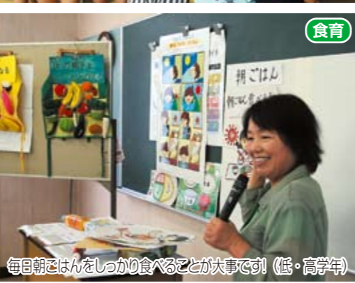
食育 毎朝ごはんをしっかり食べることが大事です! (低・高学年)