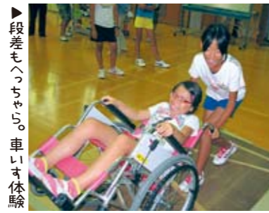
▶段差もへっちゃら。車いす体験