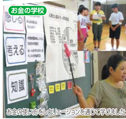
お金の学校 お金の使い方をレクリエーションを通じて学びました (高学年)