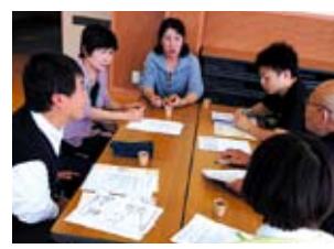
▲福祉員座談会で地域の心配ごとを話し合います。

◆福祉員の設置と関係機関の連携 福祉員とは、各行政区に1名以上を配置して、地域の福祉課題をいち早く発見し、民生児童委員や区長、行政、社協につなぐ役割を持った方です。 地区座談会で関係機関の情報交換を充実させて福祉の町づくりを進めています。