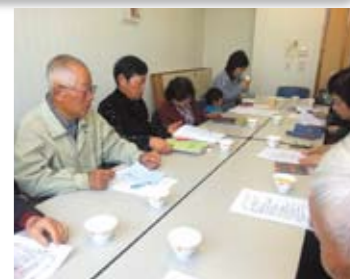
ボランティア団体の情報交換