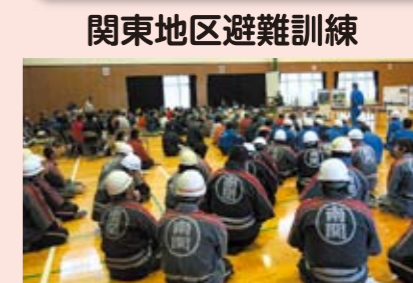
関東地区避難訓練