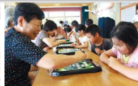
世代間交流事業でオセロ大会