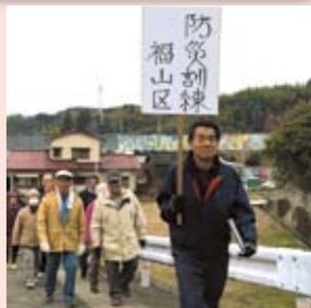
自主防災活動に協力しています