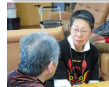
傾聴ボランティアの育成