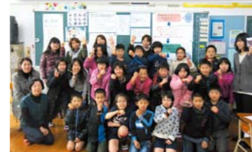
認知症サポーター養成