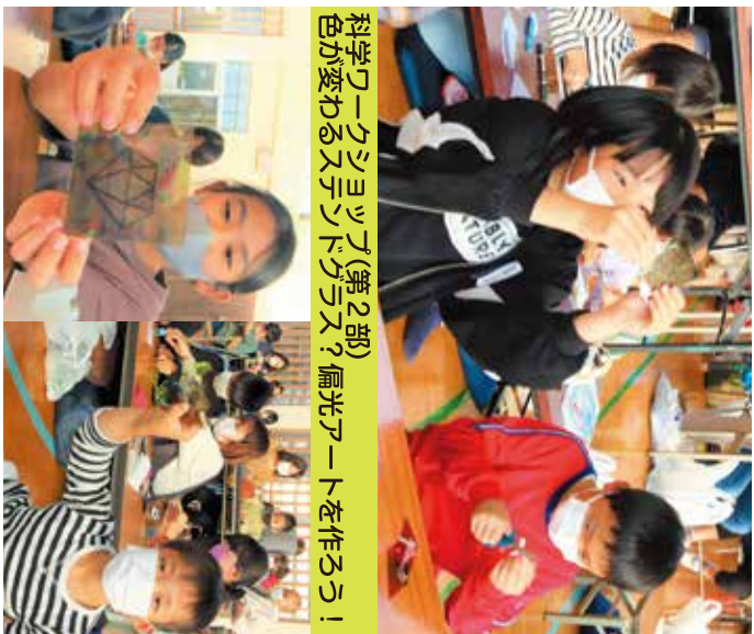
科学ワークショップ(第2部) 色が変わるスリッドグラス? 偏光アートを作ろう!