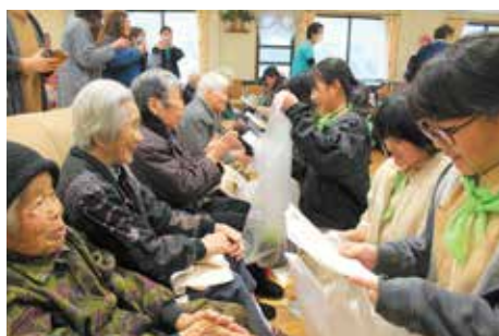
利用者に、励ましのお手紙を読みあげる児童