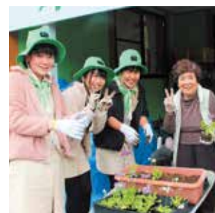
一緒に花を植え、児童も利用者もニコリ笑顔