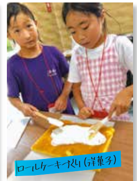
ロールケーキ作り(洋菓子)