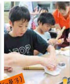
ねいほり体験(和菓子)