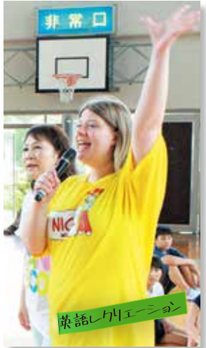
英語レクリエーション