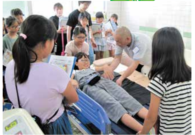
▲機械のお風呂で入浴介助を体験