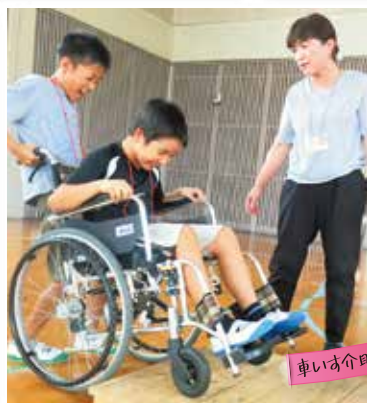
車いす介助体験(ヒューマンネットワーク熊本)