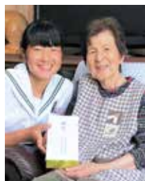
▲訪問時のプレゼントを作成。社会福祉協議会の連絡先を書いたティッシュを配布。

健康状態や心配事がないか話を聞いたあと、「身内や業者などをかたる人物がカードを預かったり、お金を要求してくるなどの相談が多く寄せられています」と悪質な電話詐欺の注意喚起をしました。