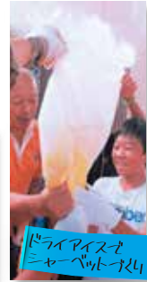
ドライアイス・ ニャーペット作り