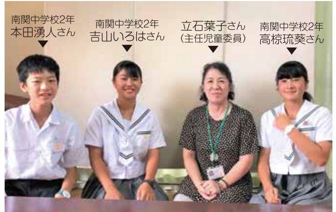
▲職場体験に参加した中学生が民生児童委員の活動を知る機会となりました。