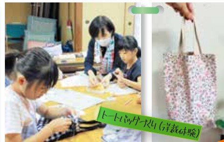
トートバッグ作り(剪裁体験)