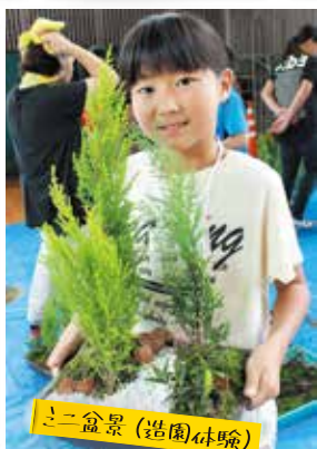
ミニ盆景(造園体験)