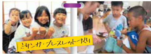
ミシンが・プレスレシート作り