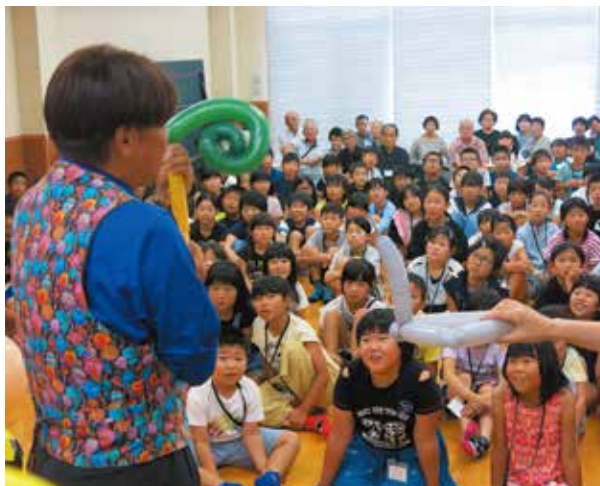
▲藤岡プロによるバルーンアートショー