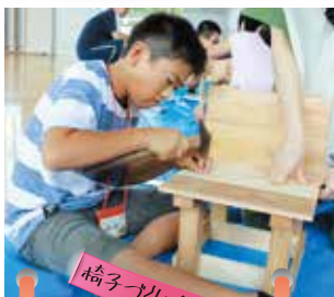
椅子作り(大工体験)