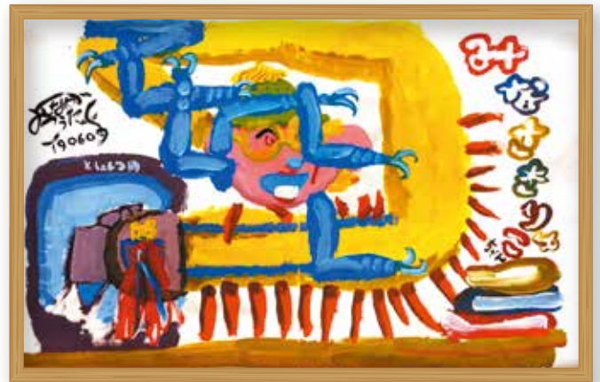
▲今回のイベントで誕生したキャラクター「みなさきりょ」は町図書館に展示されています。