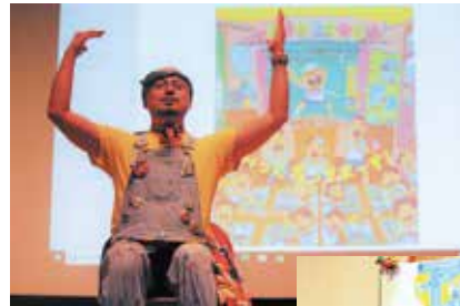
◀全身で作品の世界を表現するよしながさん【作者本人の給食番長読み聞かせの様子】