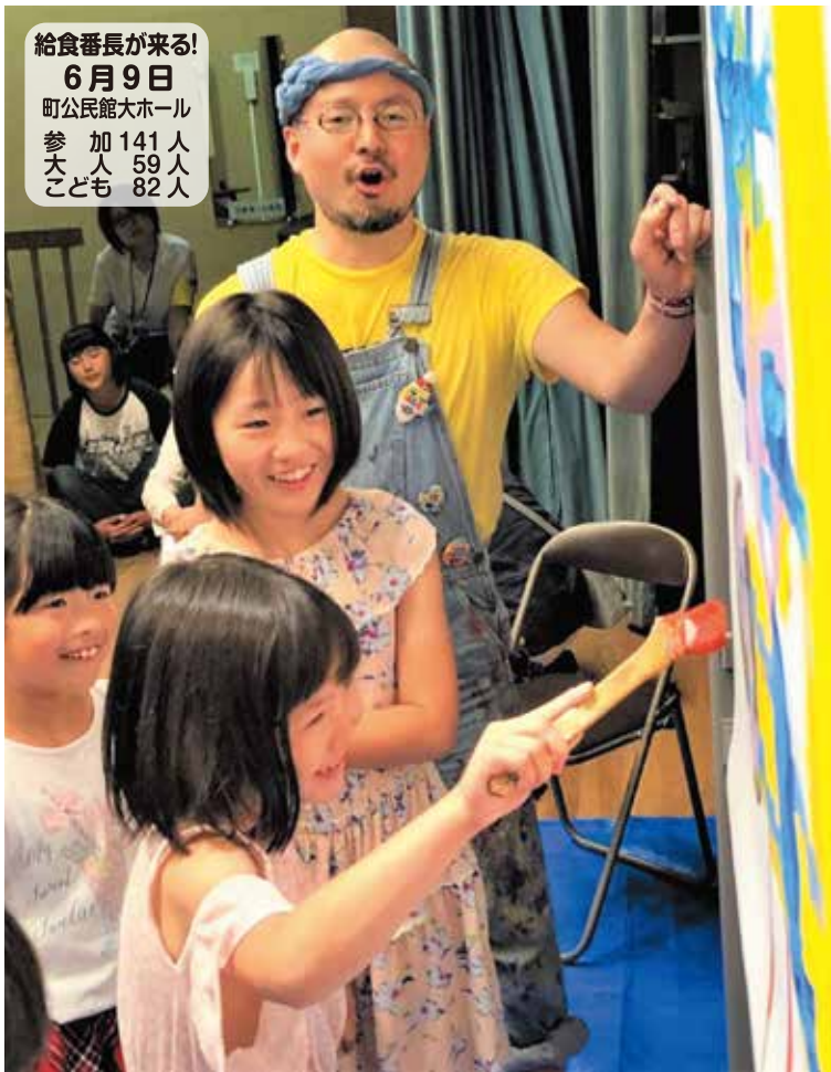
▲キャンバスに絵を書き足して不思議な生き物ができあがっていくよ。

給食番長が来る! 6月9日 町公民館大ホール 参加 141人 大人 59人 子ども 82人