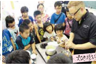
ふくしの栽培体験 お菓子作り