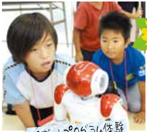
ロボットプログラム体験