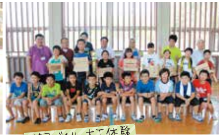
椅子づくり 木工体験