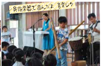
民族楽器で遊んだよ 音楽レク