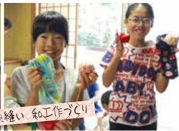
針糸縫い 和工づくり