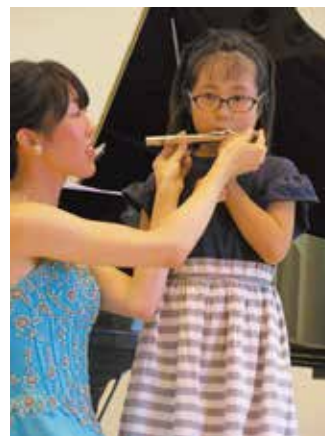
▲体験コーナーでフルートの音出しに参加者もチャレンジしました。