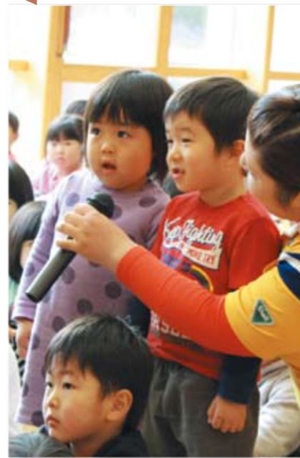
▲サンタさんに質問する子ども達