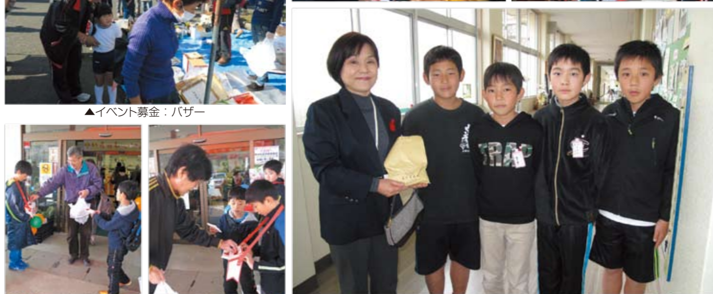
▲街頭募金：第3小学校